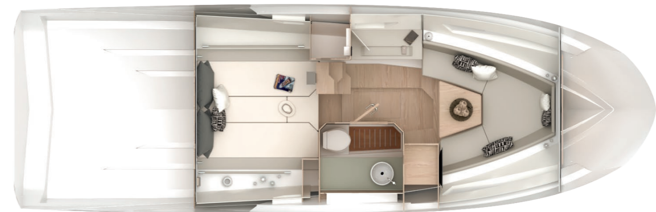
INBOARD LOWERDECK LAYOUT

The mix between the different colors and materials, together with the side windows on the hull, contributes to bright the area, that becomes even more livable during the day and the evening too.