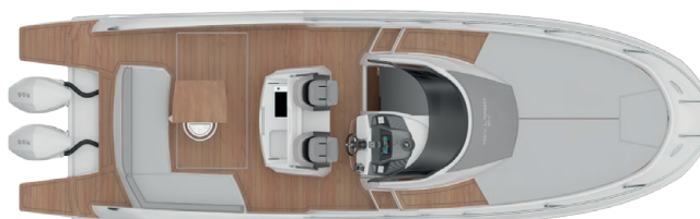
OUTBOARD MAINDECK LAYOUT OPEN VERSION

Tutti i dati e le immagini riportati sul presente catalogo sono puramente indicativi. SESSA MARINE si riserva il diritto di variare le caratteristiche dei suoi prodotti senza alcun preavviso.